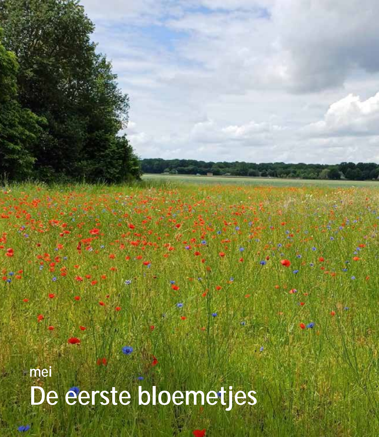
mei De eerste bloemetjes